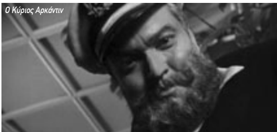
Ο Κύριος Αρκάντιν