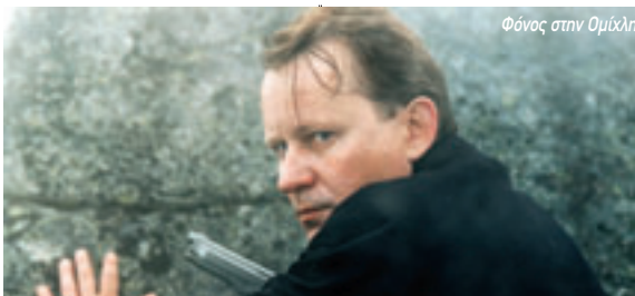
Φόνος στην Ομίκλη

Δύο επαγγελματίες δολοφόνοι σκοτώνουν έναν υπάλληλο βενζινοδίκου. Ασφαλιστικός υπάλληλος θα κυνηγήσει την υπόθεση και θα ανακαλύψει ένα δίκτυο διαφθοράς σε άμεση σχέση με την μυστηριώδη Κίτι Κόλινς. Υποψήφιο για τσε-