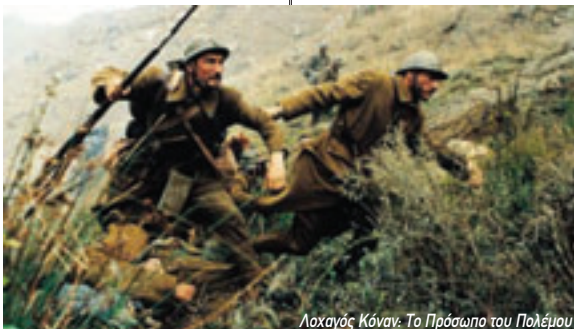
Λοχαγός Κόναν: Το Πρόσωπο του Πολέμου

Αυτή η ταινία του Όλε Κρίστιαν Μάντσεν σε μεταφέρει πίσω στον Β' Παγκόσμιο Πόλεμο και στη δανέζικη αντίσταση κατά των Ναζι. Σε μια χώρα που έχει κατηγορηθεί πολλές φορές για τη συνεργασία της με το ναζιστικό καθεστώς, έρχεται αυτή η ιστορία δύο θυμωμένων νέων, που πιάνουν τα όπλα και καθαρίζουν κόσμο. Κυριολεκτικά, σκληρά, απάνθρωπα. Εντυπω-