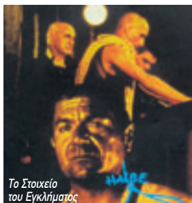
Το Στοιχείο του Εγκλήματος

Με όχημα του μια πολύ ιδιαίτερη οικογένεια, ο Ρόι Άντερσον πατάει στα γερά θεμέλια του σουρεαλισμού και εμπνεόμενος από τον