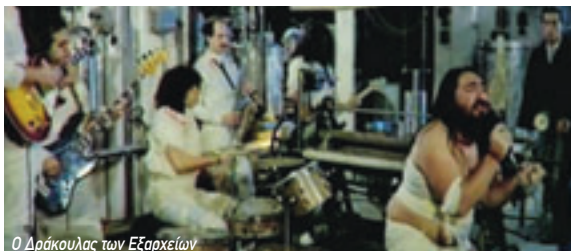
Ο Δράκουλας των Εξαρχείων

Κυριακή έως Πέμπτη 00.20 Σύνταγμα προς Αγ. Αντώνιο-Δουκίσσης Πλακεντίας Παρασκευή & Σάββατο 2.20 Σύνταγμα προς Αγ. Αντώνιο-Δουκίσσης Πλακεντίας