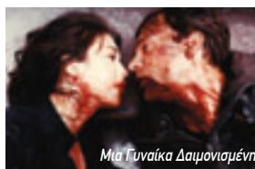
Μια Γυναίκα Δαμονισμένη

Με τις εξαιρετικές ερμηνείες των Σίρλεϊ Στόλερ και Τόνι Λο Μπιάνκο.