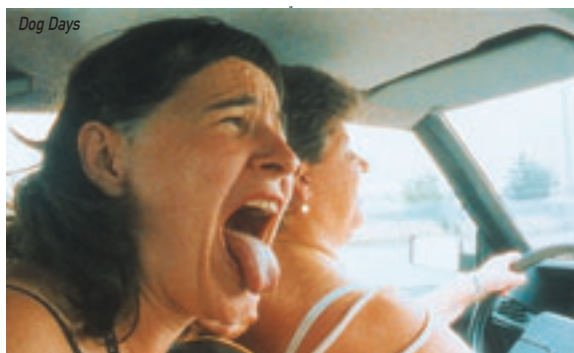
Taxi 1996, 110'

Κυριακή έως Πέμπτη 00.20 Σύνταγμα προς Αγ. Αντώνιο-Δουκίσης Πλακεντίας Παρασκευή & Σάββατο 2.20 Σύνταγμα προς Αγ. Αντώνιο-Δουκίσης Πλακεντίας