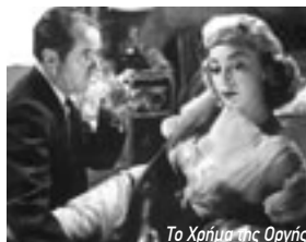
Το Χρήμα της Οργής

Το αριστούργημα του Ρομπέρ Μπρεσόν αποτυπώνει την ένδεια στο Παρίσι μετά τον πόλεμο. Με την αξεχαστη ερμηνεία του Μαρτίν Λαζάλ. Ο Μισέλ, ένας νεαρός άνδρας που ζει σε μια τρώγλη, μαθαίνει την τέχνη του πορτοφολά και επιδιέχεται σ' αυτή χωρίς να μπορεί να ξεφύγει. Όμως η Ζαν, μια κοπέλα που τον αγαπά, θα αποδειχθεί η σωτηρία του.