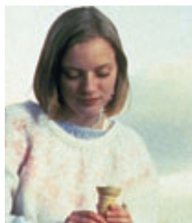
Το Γλυκό Περωμένο (The Sweet Hereafter) 1997, 112'

Η κοινότυπη μιας μικρής πόλης προσπαθεί να συνέλθει από τον οδυνηρό θάνατο που βρήκαν πολλά από τα μικρά παιδιά της, έπειτα από το τραγικό αυτοκινητιστικό δυστύχημα ενός λεωφορείου. Υποψήφια για Όσκαρ σκηνοθεσίας, σεναρίου, και τρία βραβεία στο Φεστιβάλ Καννών. Με τις αισθαντικές ερμηνείες των Άνν Χολμ και Σάρα Πόλεϊ.