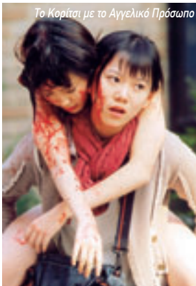
Το Κορίτσι με το Αγγελικό Πρόσωπο

Σε περίοδο πολιτικής και κοινωνικής ανασταραχής στην Κορέα του 19ου αιώνα, ένας αυτοδίδακτος ζωγράφος προσπαθεί να επιβιώσει και να δημιουργήσει με αυτά που έχει στο μέσα του. Βραβείο Σκηνοθεσίας στο Φεστιβάλ