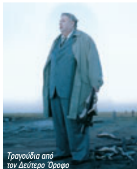
Τραγούδια από τον Δεύτερο Όροφο

Περουβιανό ποιητή Σεζάρ Βαλέχο, μιλάει για την αγάπη, την ερωτική σύγκυση, το μεγαλείο και τις μικρότερες μας σχέσεις, τα ψέματα και την εγκατάλειψη, τη συντροφικότητα και την επιβεβαίωση. Μεγάλο Βραβείο της Επιτροπής των Καννών για τον Σουηδό σκηνοθέτη, που έχει δημιουργήσει το δικό του φανατικό κοινό.