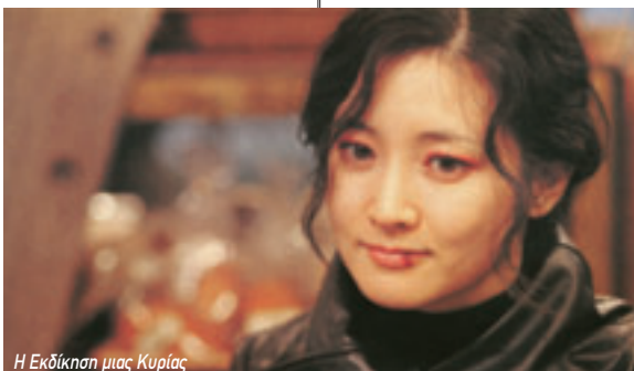
Η Εκδίκηση μιας Κυρίας

Έπειτα από 13,5 χρόνια στη φυλακή για την απαγωγή και τη δολοφονία του μικρού αγοριού του Παρκ, η Λι αποφυλακίζεται και προσπαθεί να φτιάξει τη ζωή της από την αρχή. Βραβείο Κοινού και ακόμη ένα βραβείο για τον Τσαν Γουκ Παρκ, στο Φεστιβάλ της Βενετίας.