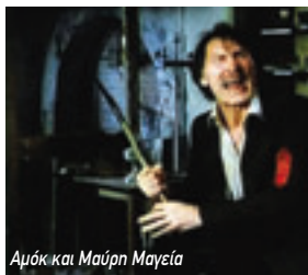
Αμόκ και Μαύρη Μαγεία

Ο αζεπεράστος Φρέντι Φράνις σκηνοθετεί από Τζακ Πάλανς μέχρι Χιου Γκρίφιθ και Τρέβορ Χάουαρντ σε αυτή την αγγλέζικη παραγωγή, κατά την οποία ιδιοκτήτης αφρικανικού ειδώλου που έχει μαγικές δυνάμεις, κυριεύεται από δολοφονική μανία.