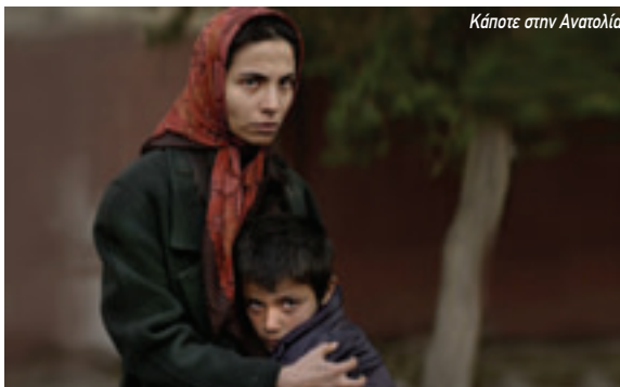
Κάποτε στην Ανατολία

Ένας αρρενωπός άντρας από την επαρχία, που εκδιέται, και ο ασθενικός φίλος του προσπαθούν να επιβιώσουν στους δύσκολους νυχτερινούς δρόμους της Νέας Υόρκης. Αυτό το εντυπωσιακό αστικό γουέστερν του Τζον Σλέινγκερ κέρδισε Όσκαρ Καλύτερης Ταινίας, Σκηνοθεσίας και Σεναρίου, καθώς και Χρυσή Σφαίρα και βραβεία στη Μπερλινάλε.