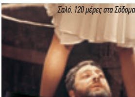
Σαλό, 120 μέρες στα Σόδομα

Νεαρός άνδρας φεύγει από την επαρχιακή πόλη του για να ζήσει το όνειρο του Παρισιού. Εκεί, όμως, ανακαλύπτει πόσο δύσκολο είναι η πραγματικότητα, όπως και οι σχέσεις φυσικά. Χαρακτηριστική, βαθιά ανθρώπινη συναισθηματική ιστορία, με τους Φιλίπ Νουαρέ και Εμανουέλ Μπεάρ. Σε σκηνοθεσία Αντρέ Τεσινέ.