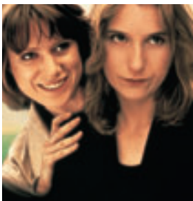
Κορίτσια Καριέρας (Career Girls)