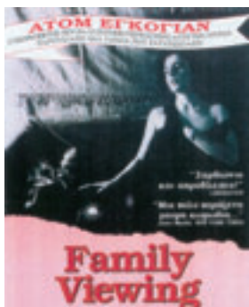
Family Viewing 1988, 86'

Μέσα από τη λατρεία του Σταν, πατέρα του Βαν, για το βίντεο και τη συνεχή καταγραφή της καθημερινής ζωής του, ξεδιπλώνεται ένα συγκινητικό οικογενειακό δράμα. Από τα πρώτα διαμαντάκια του Ατόμ Εγκογιάν, που κέρδισε βραβεία στα Φεστιβάλ Βερολίνου, Λοκάρνο και Τορόντο.